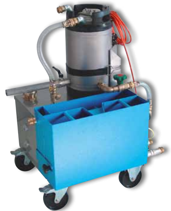
Länge: 750 mm Breite: 500 mm Höhe: 950 mm