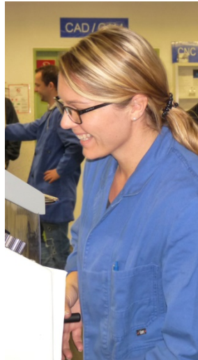
Gut gelaunte Teilnehmer/innen präsentieren Ihr Können