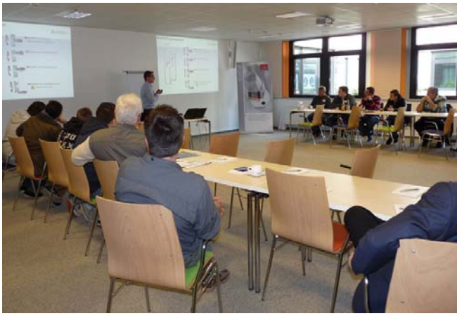
Bild1, Seite 1: Intensive Fachgespräche